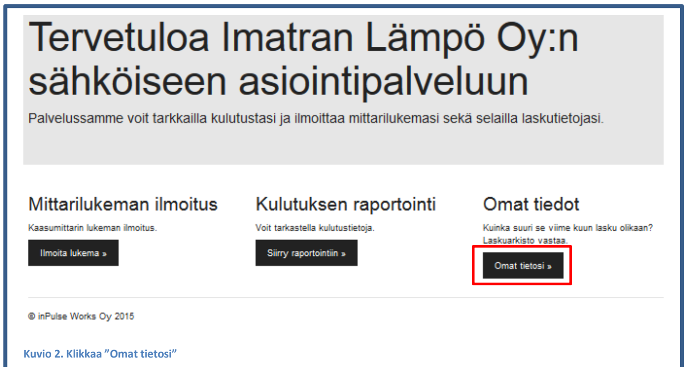
Kuvio 2. Klikkaa "Omat tietosi"