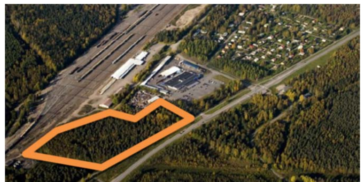
Kuvassa on esitetty lämpökeskuksen sijainti.