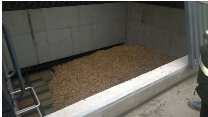
Ensimmäiset savut 23.9.2015 klo 11:04 sekä haketta polttoainevarastossa